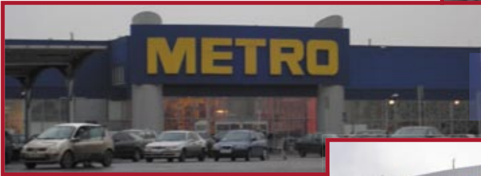
● Сеть магазинов «МЕТРО»