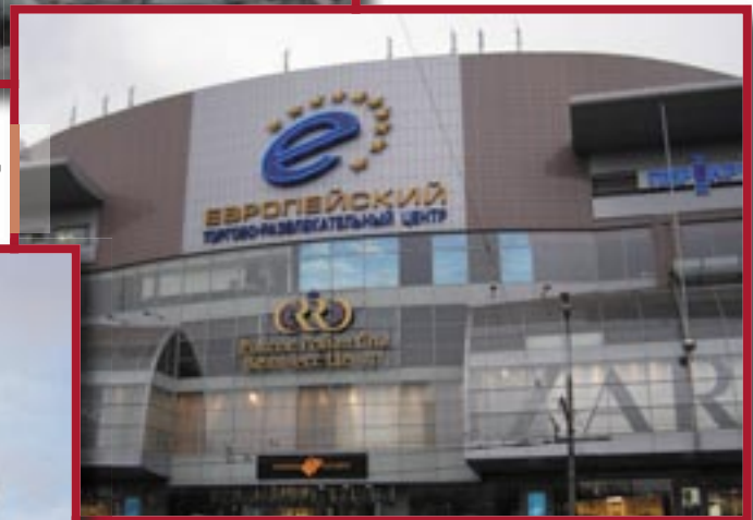
● Торговый комплекс «Европейский», Площадь киевского вокзала.