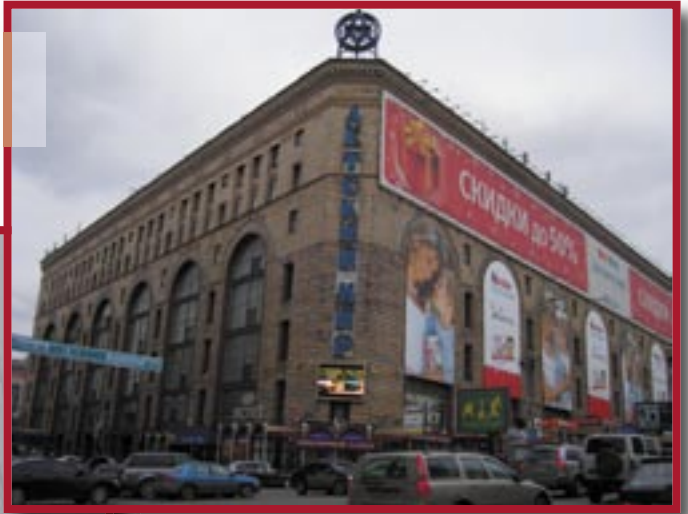
● Детский Мир, ул. Охотный ряд