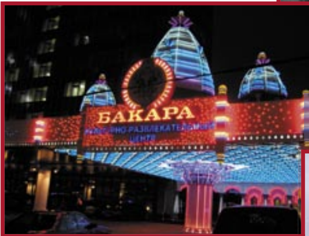
● Казино Бакара, ул Вавилова