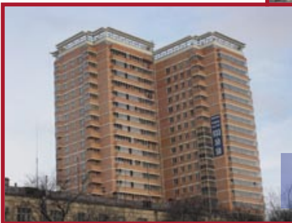
● «Жилой Дом», Можайское шоссе, д.6.