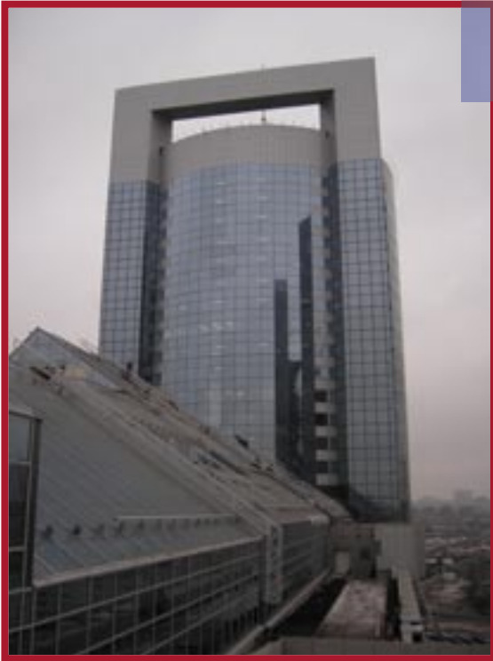
● Деловой коммерческий центр «Москва-Сити», Северная башня.