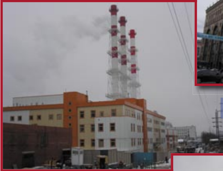
● РТС «Химки-Ховрино»