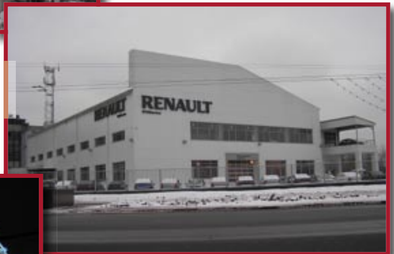
● Автосалон Рено, на ул. Обручева.