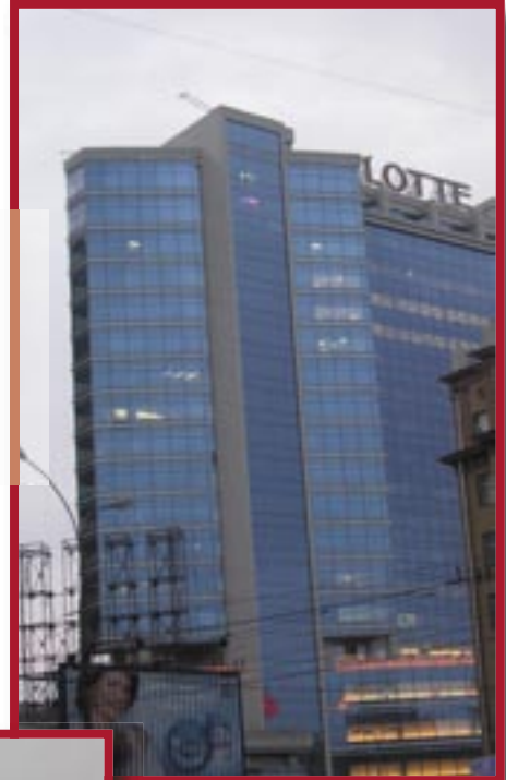
● Гостинично-деловой центр «Lote Plaza». Москва, Новинский б-р